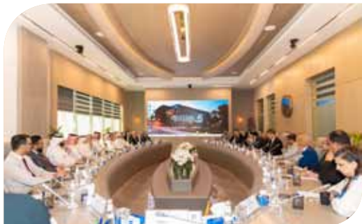
اختتام زيارة فريق هيئة الاعتماد الأكاديمي الدولي (ABET) لكلية الهندسة