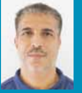
إعداد وإشراف: د. حسين ياسين قسم الدراسات العامة - الصحة والتربية البدنية