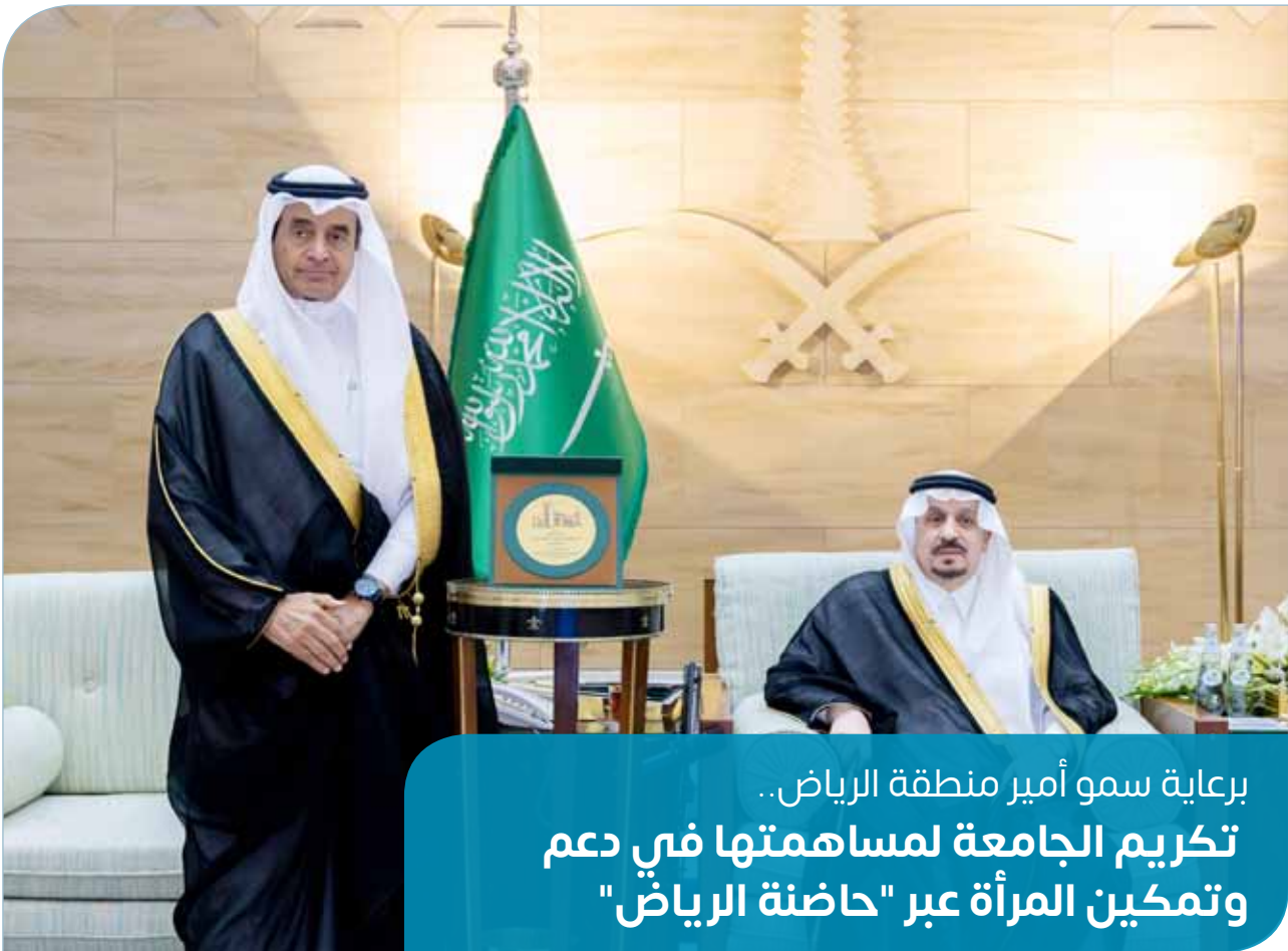
برعاية سمو أمير منطقة الرياض.. تكرم الجامعة لمساهمتها في دعم وتمكين المرأة عبر "حاضنة الرياض"