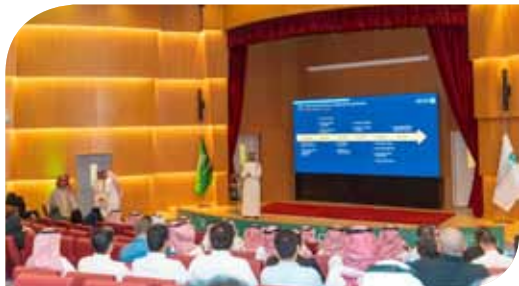
تدشين إستراتيجية الجامعة للتحول الرقمي