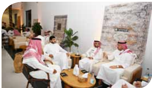
إقامة فعالية (بين المؤسسين) في نسختها الثالثة