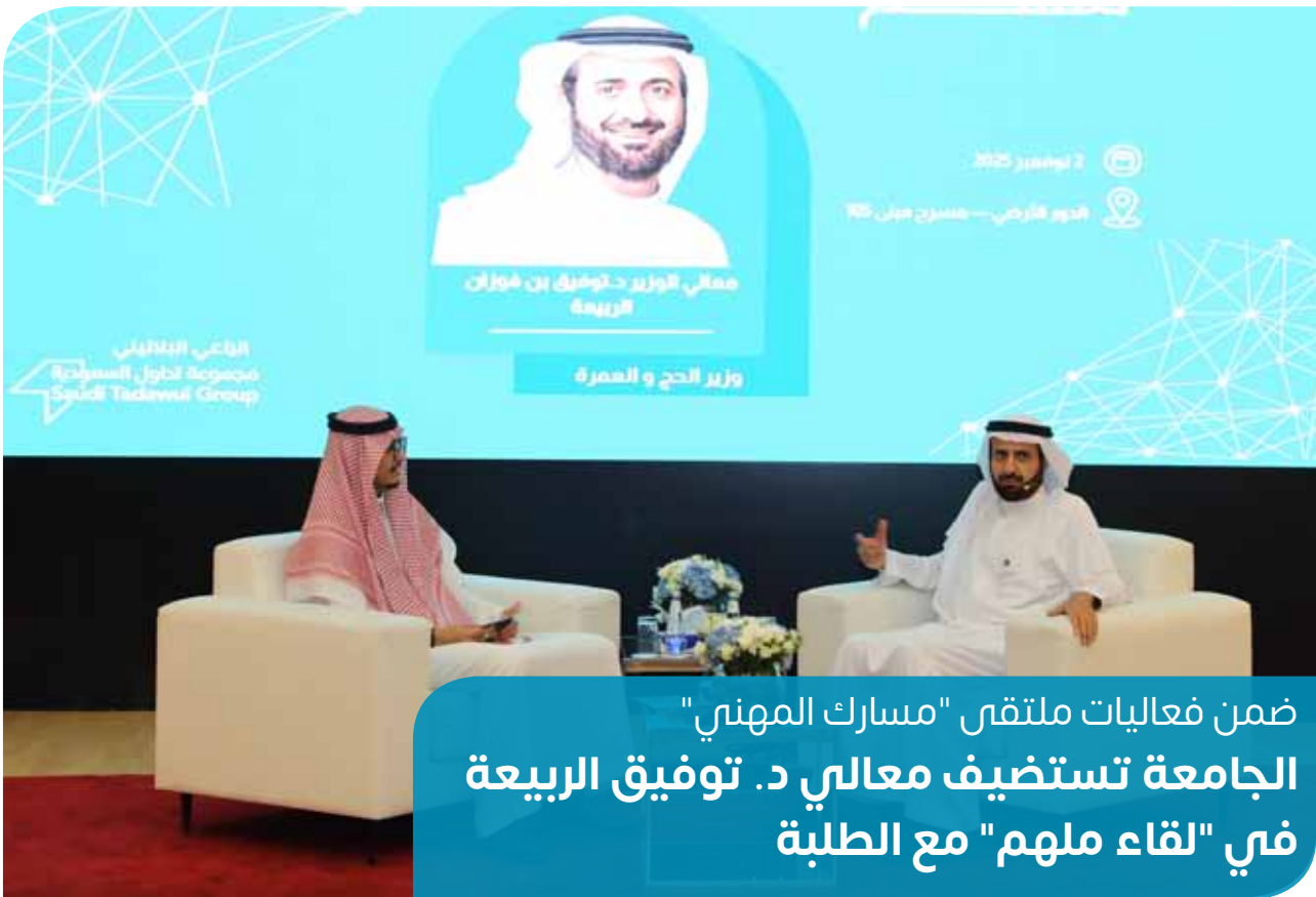
ضمن فعاليات ملتقى "مسارك المهني" الجامعة تستضيف معالي د. توفيق الربيعه في "لقاء ملهم" مع الطلبة