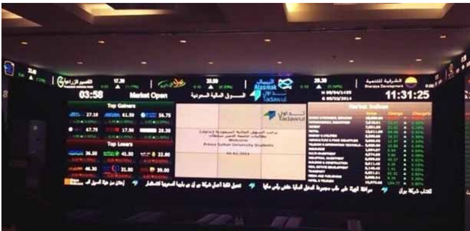
زيارة نظمها نادي المالية للسوق المالية السعودية (تداول)